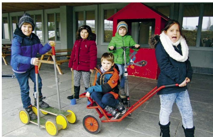
...wie viel Bewegung und Spiel.