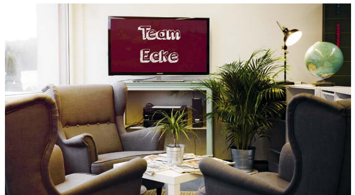
Die Teamecke – ein Ort für soziale Begegnungen