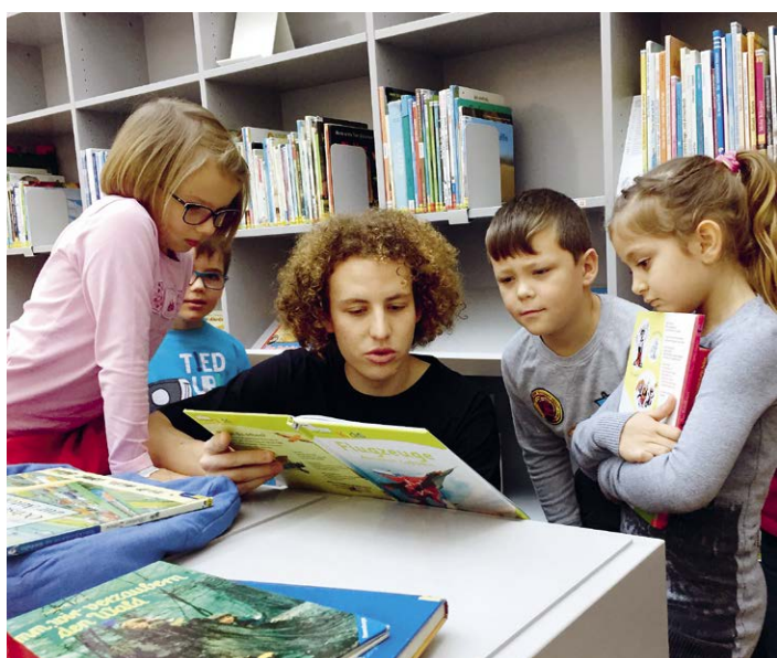
Spannende Lese- und Erzählstunde in der Bibliothek mit der Klasse 2a