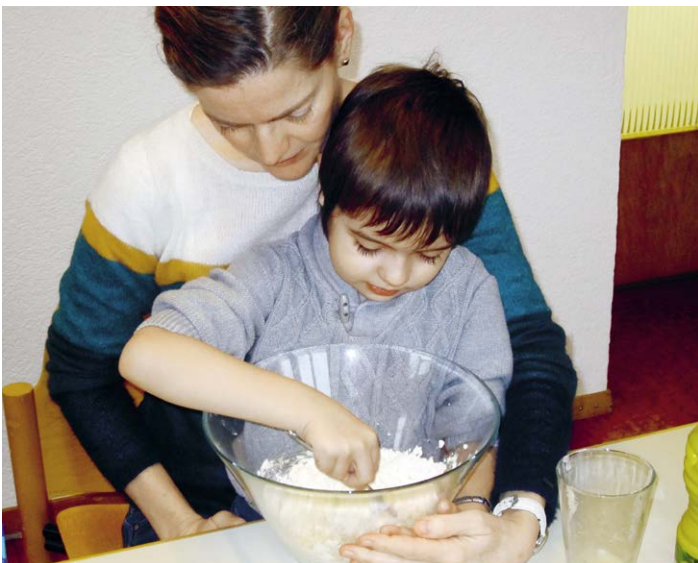
Mit der rechten Hand stabilisiert die Logopädin das Sitzen, mit der anderen Hand die linke Körperseite des Kindes. Es kann nun seine rechte Hand dosiert bewegen.

Wenn Kinder Sprache nicht oder anders erwerben als andere Kinder, gründet dies in vielen Fällen auf Problemen im Bereich der taktil-kinästhetischen Wahrnehmung. Eine intakte Wahrnehmung in Verbindung mit guten kognitiven Möglichkeiten sind die notwendige Voraussetzung für eine unauffällige Entwicklung in allen Bereichen des Lernens, zum Beispiel soziales Verhalten, Problemlösungen im Alltag, adäquater Umgang mit Mengen und Zahlen sowie Sprache.