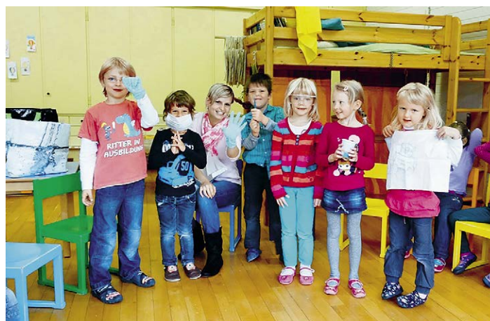
Mit themenbezogenen Spielen macht die Zahnpflege viel Spass.