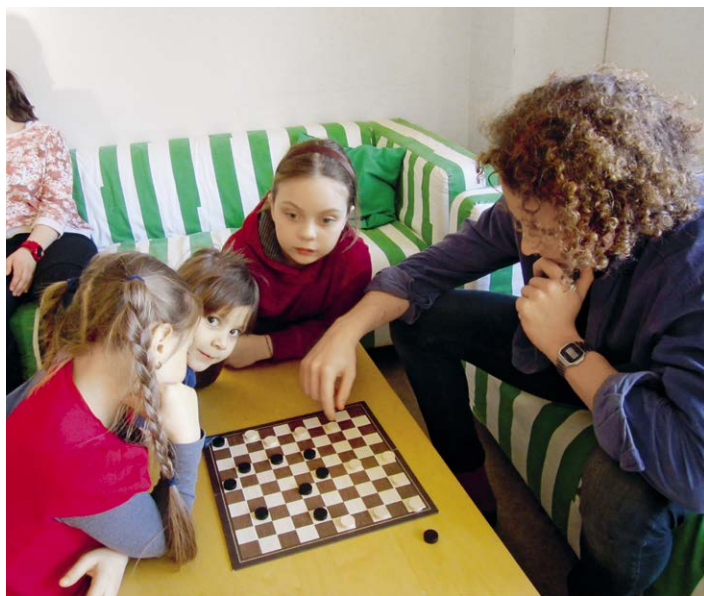
Grosse Konzentration beim Spielen in der Tagesstruktur

Ende September begann der erste «Zivi» seinen Dienst bei uns. Für ein Jahr arbeitet er unter der Anleitung und Führung der zuständigen Lehrpersonen und Leiterinnen der Tagesstrukturen. Seine verschiedenen Aufgaben sind in einem Pflichtenheft geregelt, welches die Vollzugsstelle Zivildienst genehmigt hat. Die Schule Willisau setzt einen Zivi in folgenden Bereichen ein: