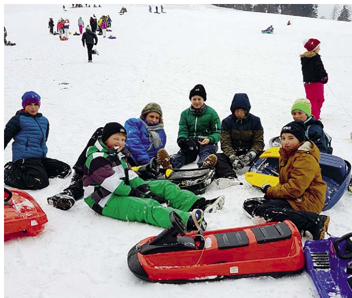
Turnstunde im Schnee mit der ersten Oberstufe