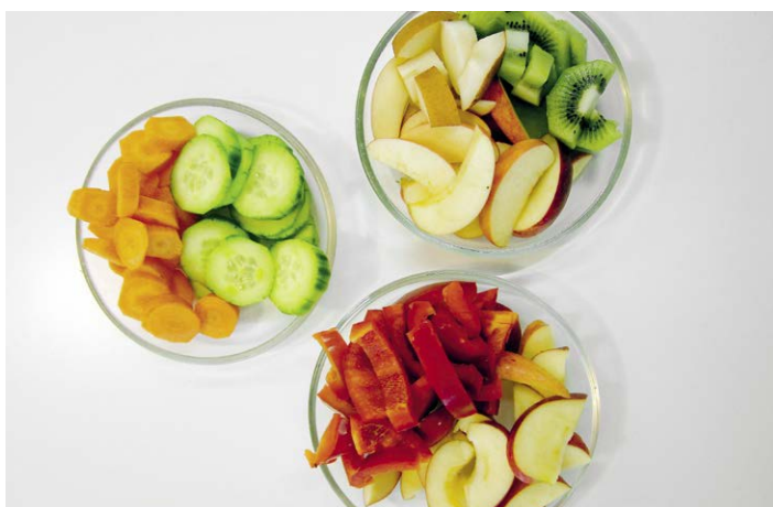
Eine gesunde Ernährung ist ebenso wichtig...