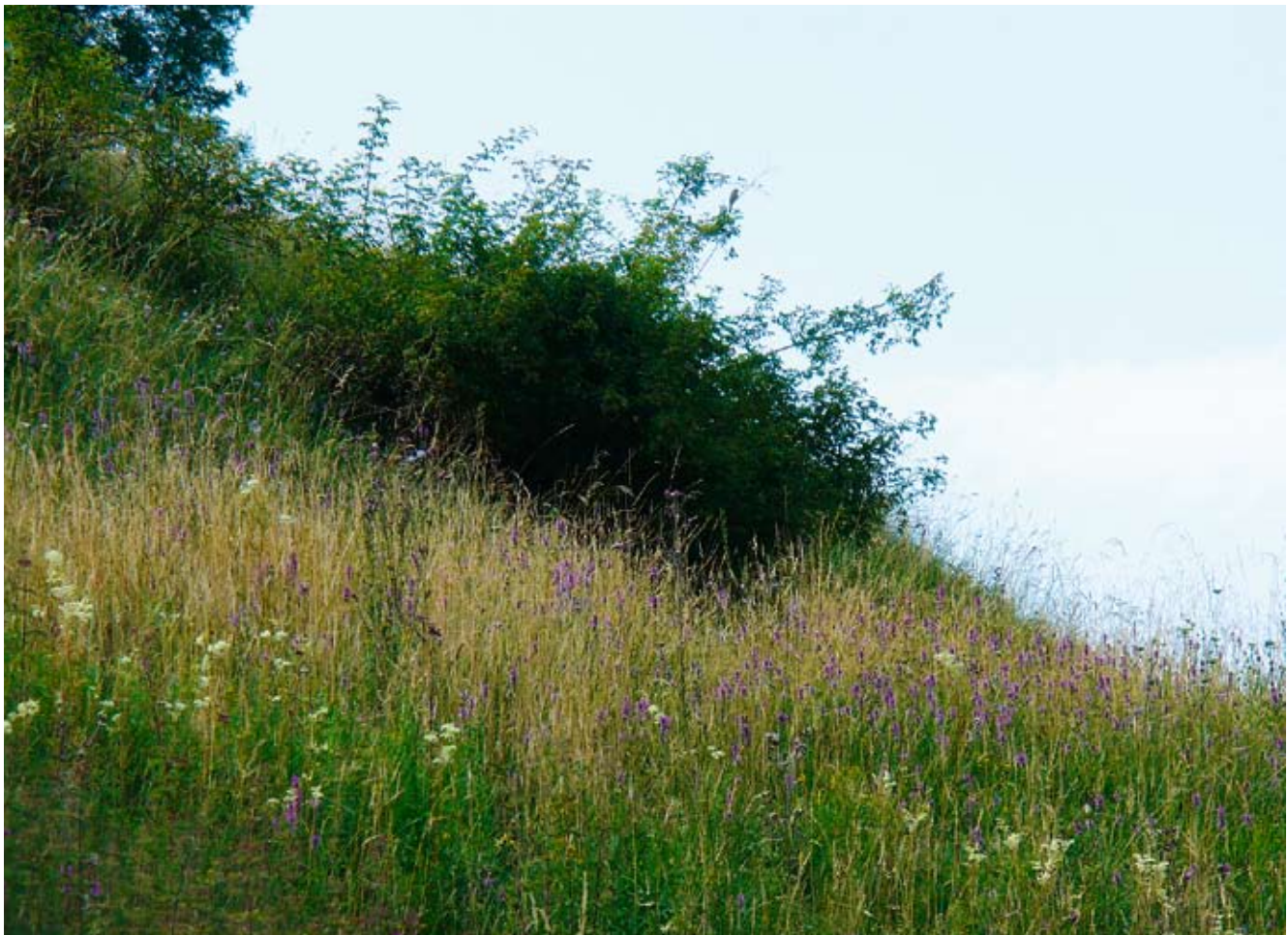
Dornenstrauch in einer Öko-Blumenwiese: Ein wertvoller Lebensraum.

Eine breit abgestützte Arbeitsgruppe mit Vertretern aus Stadtrat, Landwirtschaft, Forst, Jagd und Natur-