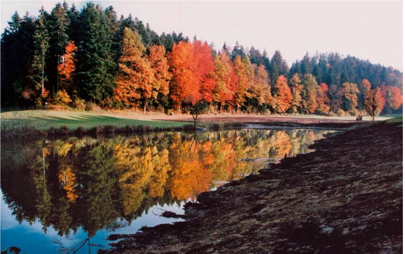
Uferabflachung bei einem Torfweiher im Ostergau.

schutzverein hat sich der Aufgabe angenommen, die Bewirtschafter von landwirtschaftlichen Nutzflächen in der Gemeinde Willisau zu beraten und zu betreuen. In einer ersten Phase wurden sämtliche Betriebe besucht und mit den Teilnahmebedingungen an einem solchen Projekt konfrontiert. Anhand von Praxisbeispielen wurden jedem Bewirtschafter die Möglichkeiten und Chancen eines solchen Projektes aufgezeigt. Als Anreiz für die freiwillige Teilnahme an einem solchen Projekt wurden den Bewirtschaftern auch die möglichen zusätzlichen Bewirtschaftungsbeiträge von Bund, Kanton und Gemeinde aufgezeigt. Diese ermöglichen es, den Landwirten bereits heute vorgeschriebene Verpflichtungen gerechter abzugelten oder mit zusätzlichen Leistungen zu optimieren.